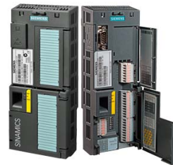
Иллюстрация аналогичная / Figure similar